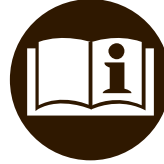
Read Manuals Before Operating Product