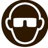
Wear Eye Protection