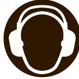
Wear Hearing Protection