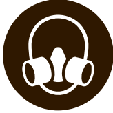
Wear Respiratory Protection